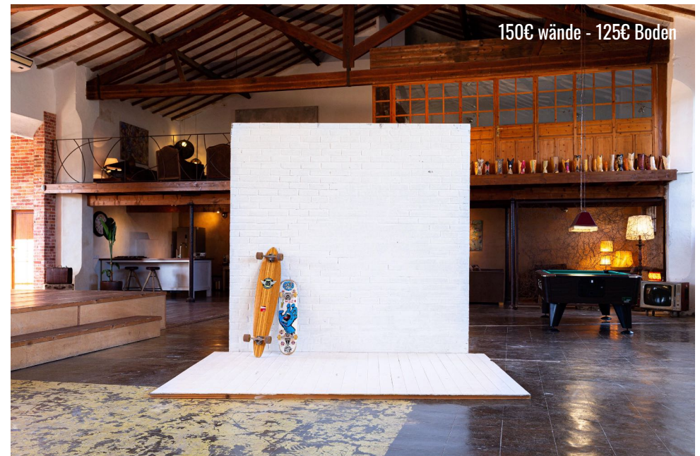
PAINTABLE BRICK WALL & WHITE FLOOR