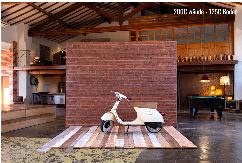
RED BRICK WALL & FLOOR BOARDS