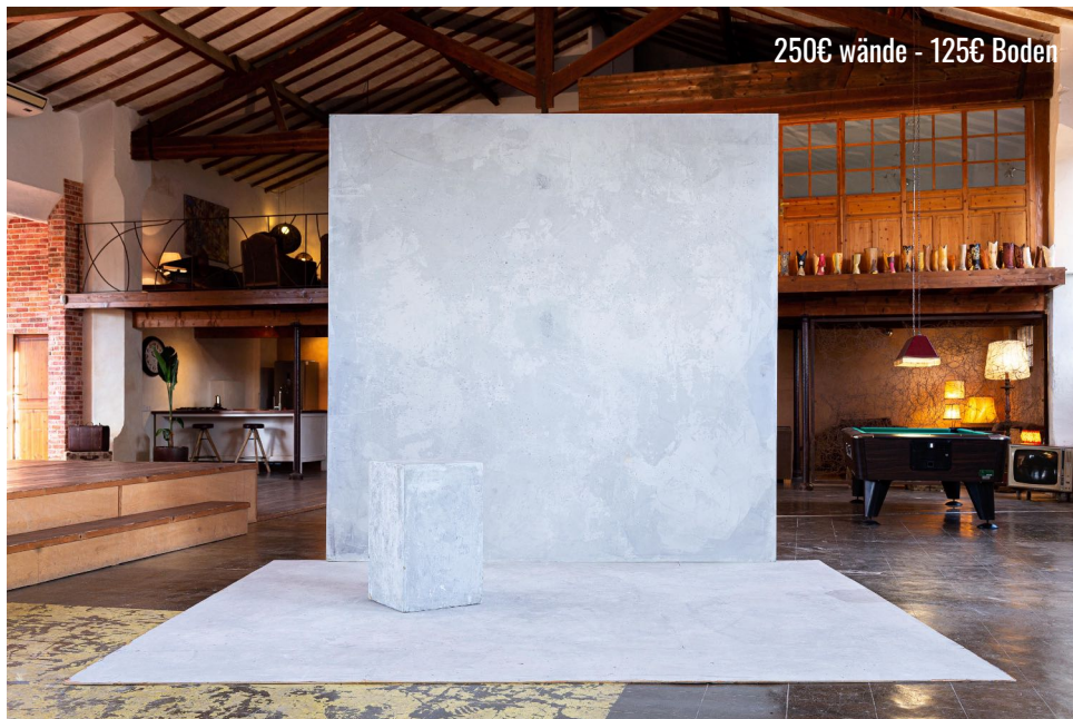
LIGHT CONCRETE WALL & FLOOR