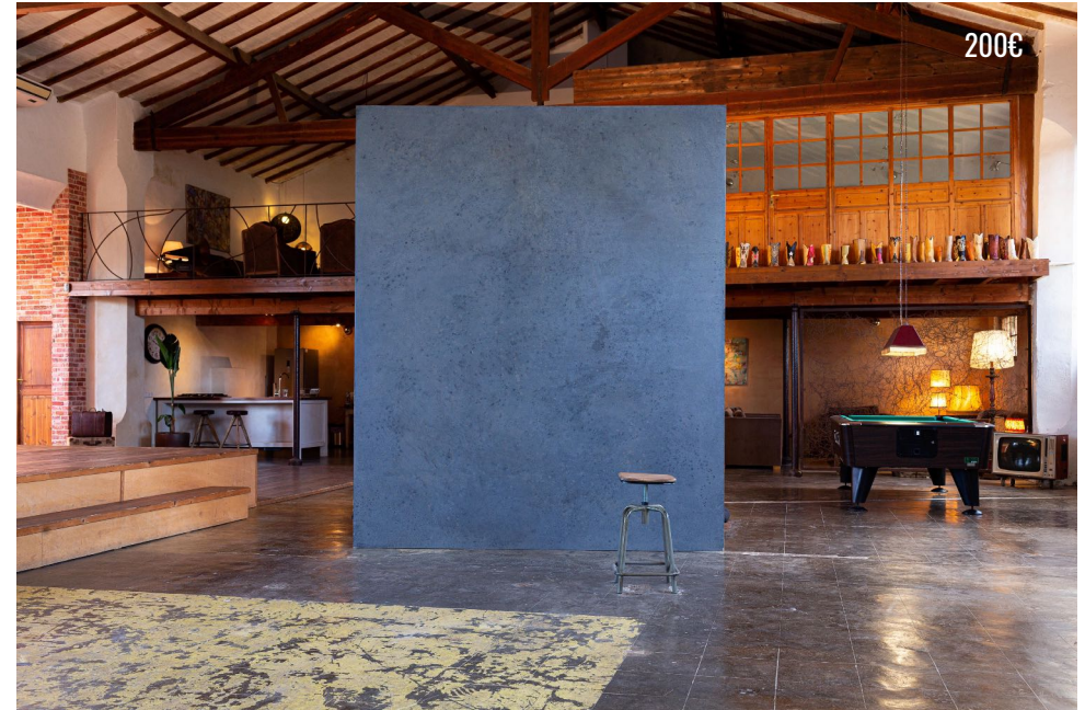
CHARCOAL CONCRETE WALL