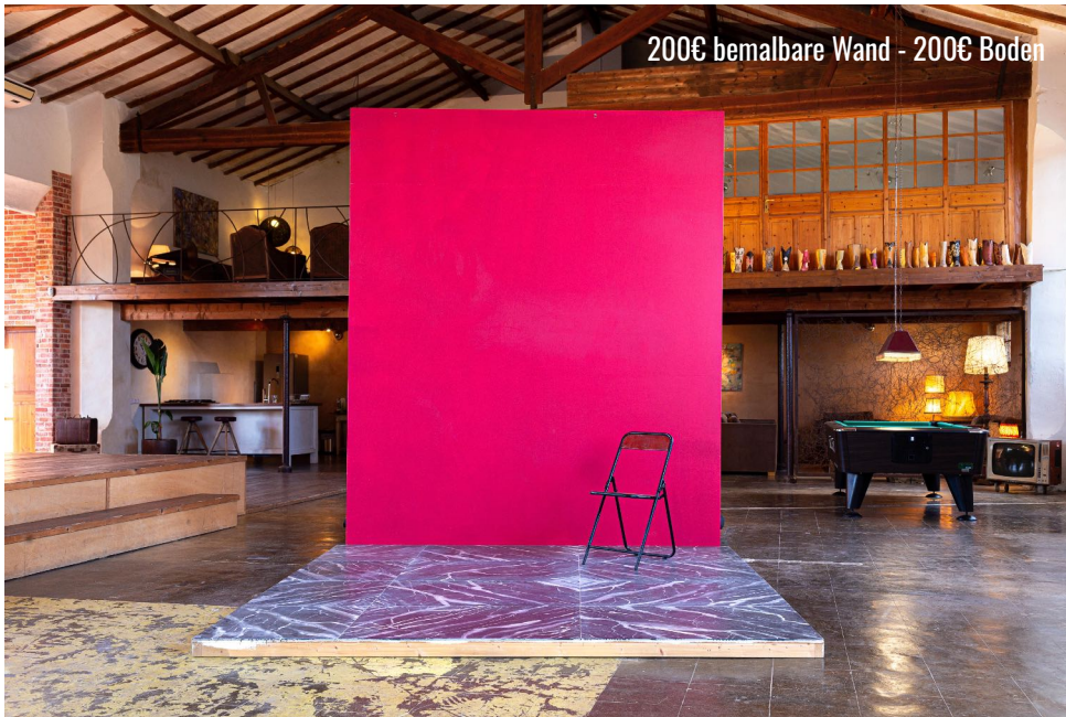
PAINTABLE WALL & MARBLE FLOOR