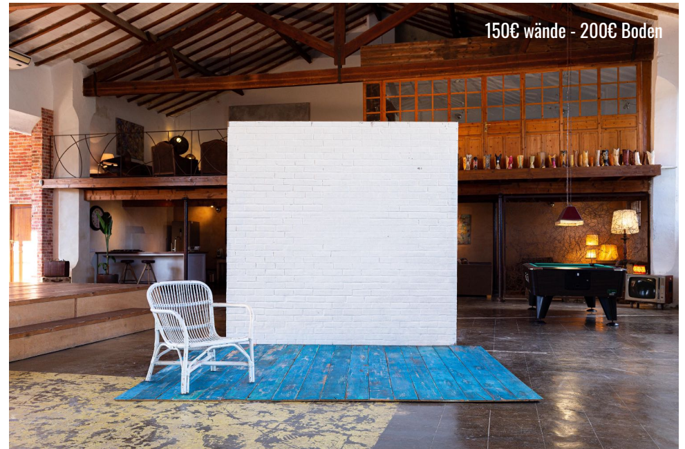
PAINTABLE BRICK WALL & BLUE FLOOR