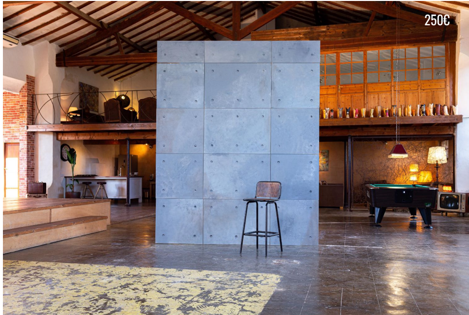
CONCRETE BLOCK WALL